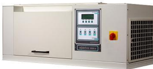
SOLARBOX 3000 E

Di conseguenza, in quanto la temperatura produce un invecchiamento accelerato, è essenziale essere in grado di controllare la B.S.T. durante la prova di esposizione a radiazione Xenon filtrata.