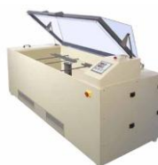
Camere a Nebbia Salina orizzontali.