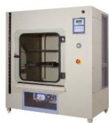
Camere a Nebbia Salina verticali.