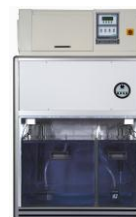
SOLARBOX R.H. con Controllo Umidità

Ci riserviamo il diritto di apportare cambiamenti ad attrezzature e sistemi in risposta agli avanzamenti tecnologici e di modificare i valori dei parametri di conseguenza.